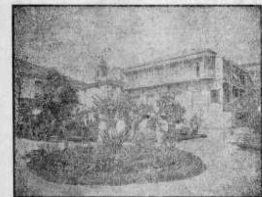
Parque de Bolívar, como estaba hace algunos años.

Por el Perú, don Manuel Lorenzo Vidaurre, Presidente de la Corte Suprema de