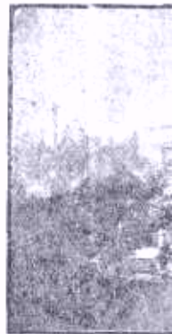
Templo de San Francisco antes de reconstrucción.

los de México y Centro América, con el fin de pactar con tratados de alianza y amistad, y de arrancarles la promesa de lo tiempo, los respectivos representantes que deberían ir a de Plenipotenciarios de la Confederación de los Estados había de reunirse en Panamá.