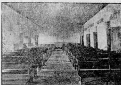
Salón del Colegio La Salle en que tuvo sus sesiones el Congreso de 1826.

Plenipotenciarios de los gobiernos de Colombia, Perú, Centro América y los Estados Unidos Mexicanos, que habian sido convocados por el primero de ellos, a instancias del Libertador Bolívar, para un Congreso del cual debería surgir un Pacto de Unión, Liga y Confederación Perpetuas, mediante el cual se consolidarían la libertad e independencia alcanzados recientemente por esos pueblos, tras cruenta y prolongada lucha.