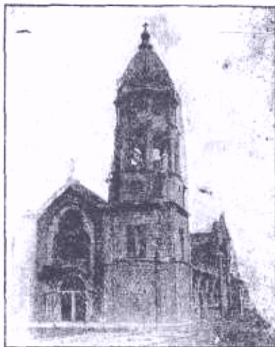
Templo de San Fco. reconstruído.