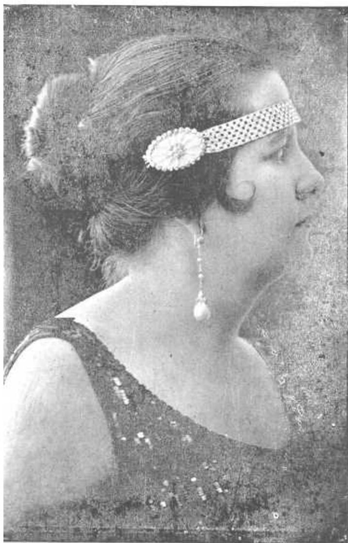
DOÑA OFELINA REMON DE CHIARI, esposa del Excmo. señor Presidente de la República.