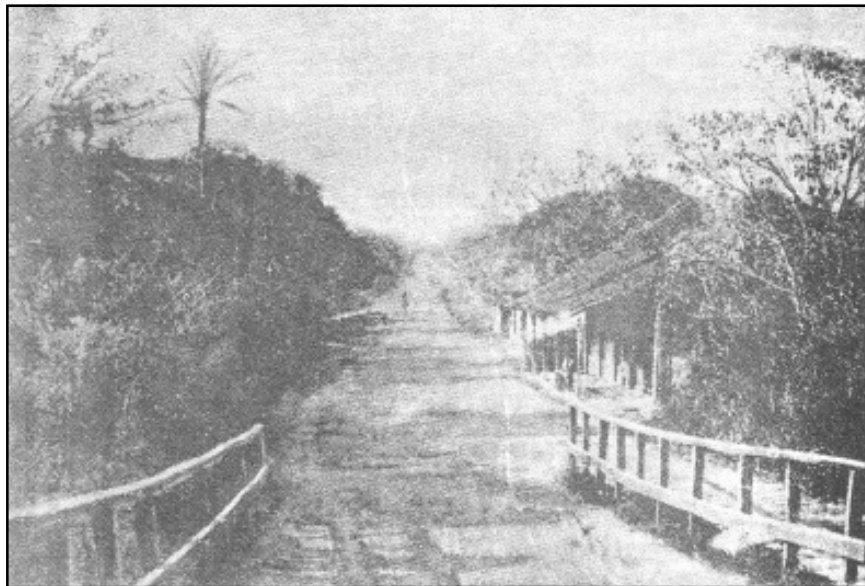
Puente de Calidonia