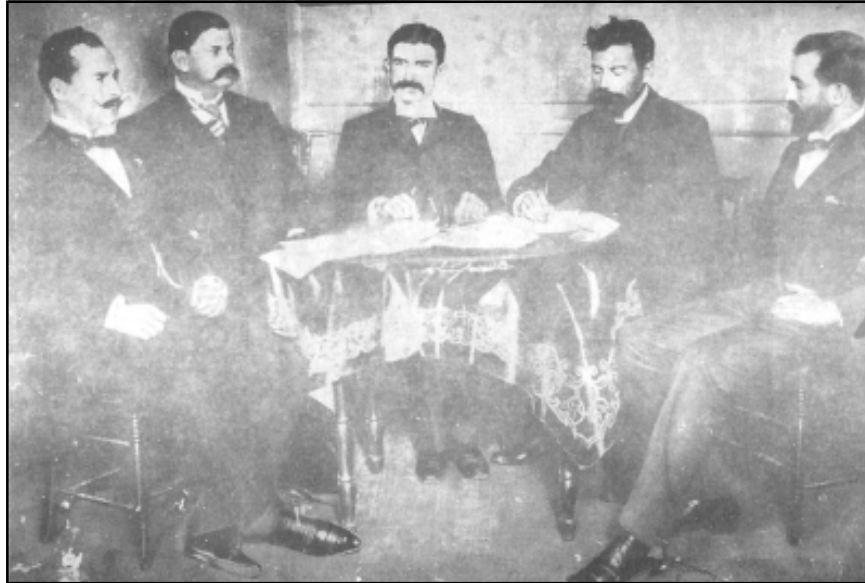
Firma de la Paz del Wisconsin . En el centro el Dr. Morales. Le acompañan el Dr. Lucas Caballero y los Generales Víctor M. Salazar, Alfredo Vásquez Cobo y Benjamín Herrera.