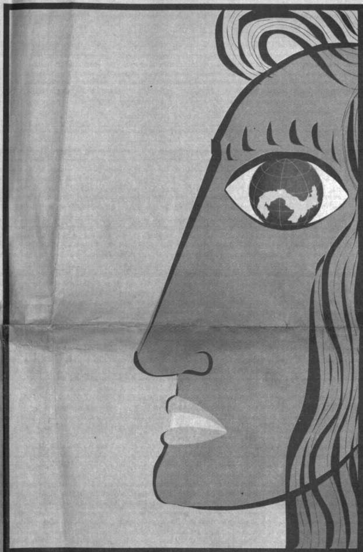
Ilustraciones: Julio Briceño

trabajadoras de una fábrica textil se aglutinaron en las calles de Nueva York para exigir la reducción de la jornada laboral de 12 horas a ocho horas, aumentos salariales y mejores condiciones de trabajo.