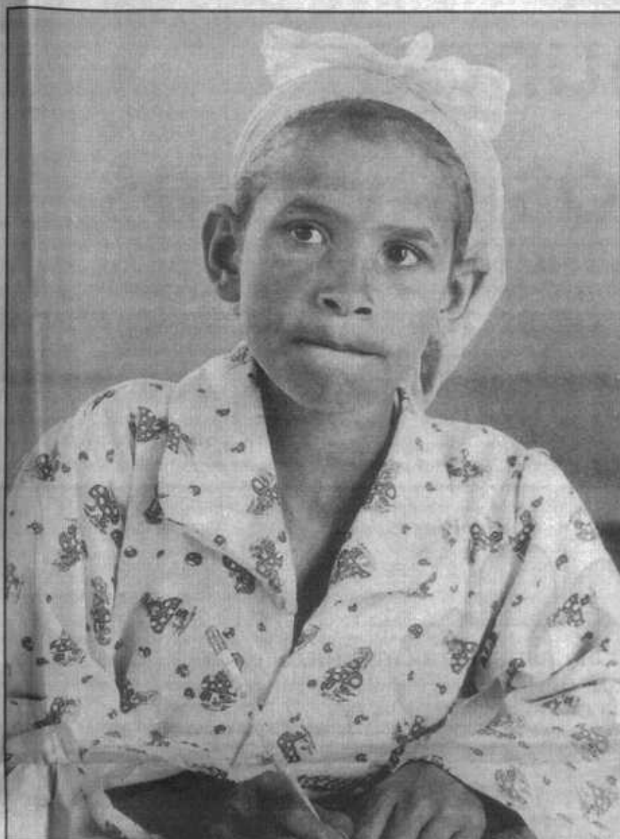
La matrícula en la escuela primaria de niñas es una quinta parte menor que la de los niños.