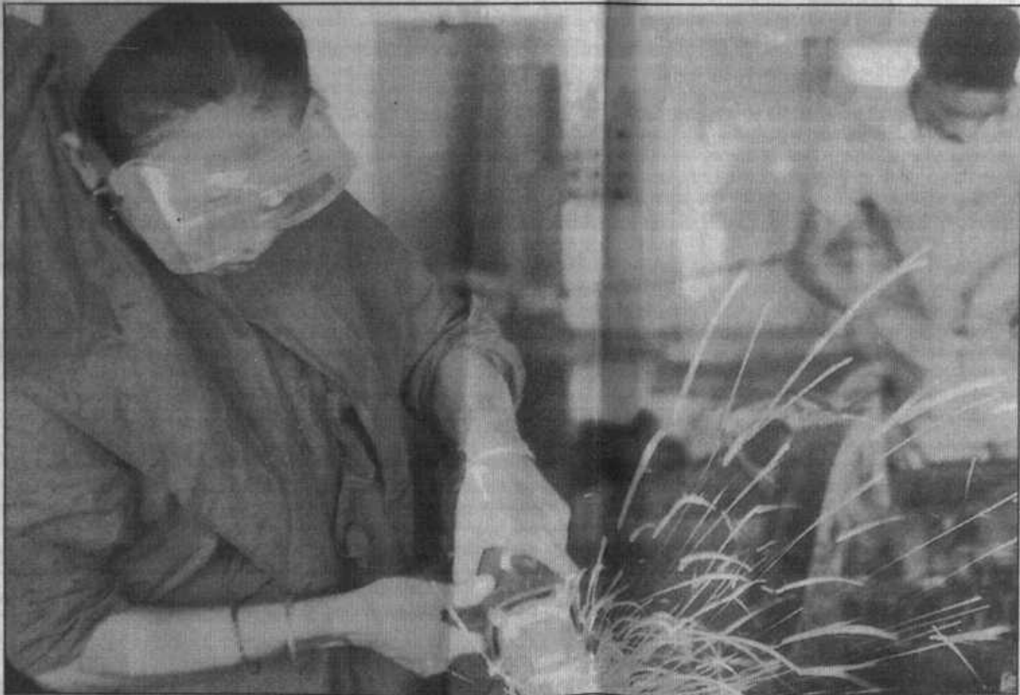
La mujer trabaja más horas que el hombre: alrededor del 25%.

coacción, violencia y explotación. En estos casos, las mujeres son objeto de explotación sexual y económica y de tratos degradantes.