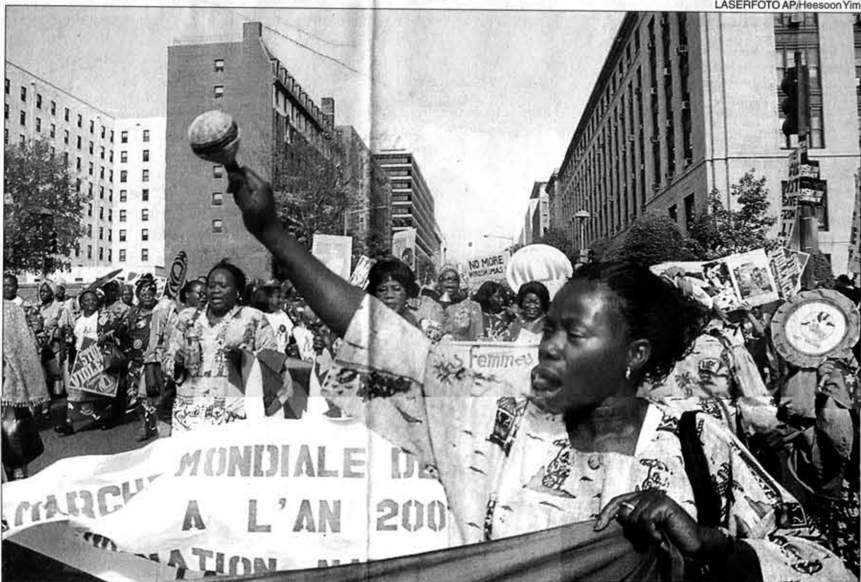
Mujeres de todo el mundo comenzaron ayer, 16 de octubre del 2000, la Marcha Mundial de Mujeres en Washington.