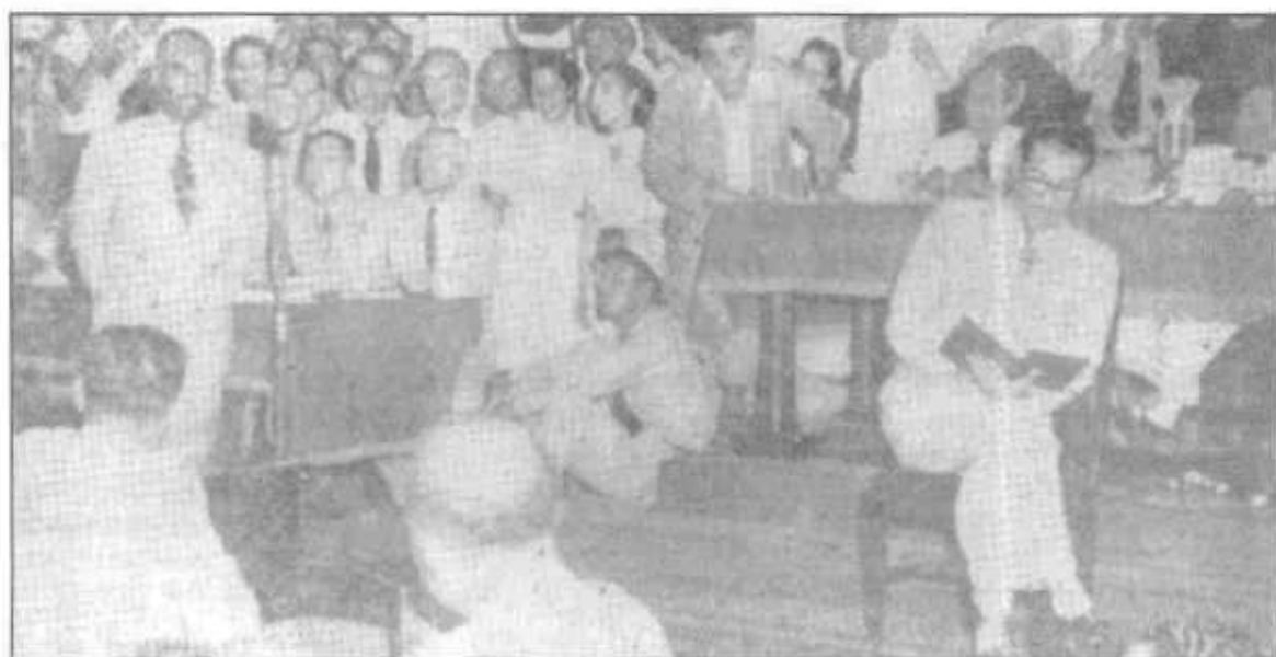
Arnulfo Arias lee el libro «Kon Tiki» durante su proceso judicial.

El 16 de mayo comenzó el juicio contra el exprimer mandatario. En la indagatoria realizada ese mismo día el líder panameñista expresó: "El Decreto de Gabinete expedido el 7 de mayo fue un Decreto inspirado en los más altos deseos patrióticos de mejorar la República. Y digo así porque ese Decreto trataba de evitar la crisis económica terrible que azotaba al país y que ponía a la República de Panamá en la línea de las otras naciones del Continente y del mundo entero que están luchando contra el comunismo, ya que en épocas anteriores tratamos de que se establecieran reglamentos y leyes para combatir el comunismo que se ha extendido en la República como lo demuestran los últimos acontecimientos que ha habido actualmente en Panamá". Asimismo, manifestó que cuando Ricardo Adolfo De la Guardia, en 1944, había derogado la Constitución de 1941 nadie había puesto objeciones ni lo había acusado de extralimitación de funciones. A lo largo del proceso que culminó el 25 de mayo, Arnulfo Arias demostró una sangre fría extraordinaria al punto que mientras sus acusadores lo incriminaban, él leía,