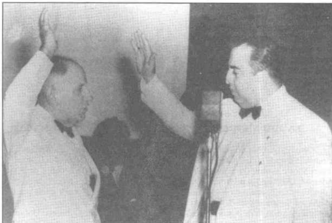
Domingo Díaz es juramentado como Presidente de Panamá (octubre de 1948).

una de las áreas más afectadas por estas economías fue el sector de Obras Públicas. No obstante, el gobierno dio impulso a varios renglones. Así, se creó la Dirección General de Aeronáutica Civil, después de la firma del Convenio de Aviación celebrado con Estados Unidos. Esta nueva Dirección tuvo bajo su cargo todo lo relacionado con el fomento de la aviación civil, conjuntamente con la Junta Nacional de Aeronáutica Civil. Huelga decir que estas Direcciones se crearon en el marco de la apertura del Aeropuerto de Tocumen a la aviación internacional. También los vuelos domésticos se vieron reforzados por la devolución a Panamá, por parte de Estados Unidos de varios sitios de defensa, como consecuencia de la finalización de la segunda guerra mundial y del rechazo del Convenio Filós-Hines. En muchos de estos sitios existían buenos aeropuertos.