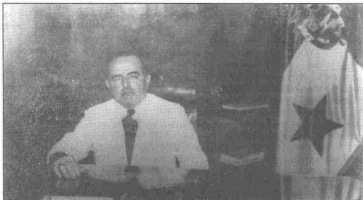
Roberto F. Chiari en la Presidencia de la República.