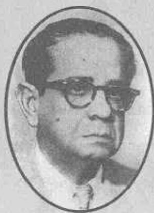
Daniel Chanis Jr.