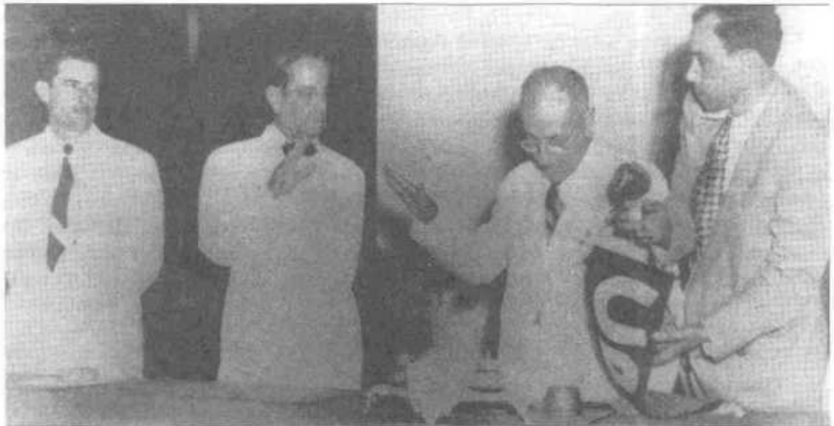
El Presidente de la Corte Suprema de Justicia juramenta al Dr. Daniel Chanis como Presidente de la República.

El 23 de agosto falleció el Presidente Domingo Díaz. Pocos días después, el 31, los educadores hicieron pública su determinación de suspender labores en señal de protesta "por estimar que los altos funcionarios del Ministerio de Educación habían infringido algunas disposiciones de la ley 47 de 1946, Orgánica de Educación". Consideraban que se había violado la norma legal cuando el Ministro nombró 6 Directores y 6 Subdirectores de Enseñanza Primaria en posiciones vacantes y también al trasladar a cuatro Profesores. Con respecto a esta situación el Ministerio sostuvo que, con el objeto de mejorar la enseñanza, se ha basado en las disposiciones que la ley establece como única condición para que los maestros puedan ser ascendidos a esos cargos, o sea que los interesados se encuentren inscritos en la 3ª categoría del escalafón. En los casos impugnados el Ministerio había sometido, además, a los aspirantes a un concurso para determinar cuál demostraba tener mejores aptitudes para la Dirección de los planteles Educativos". Respecto a