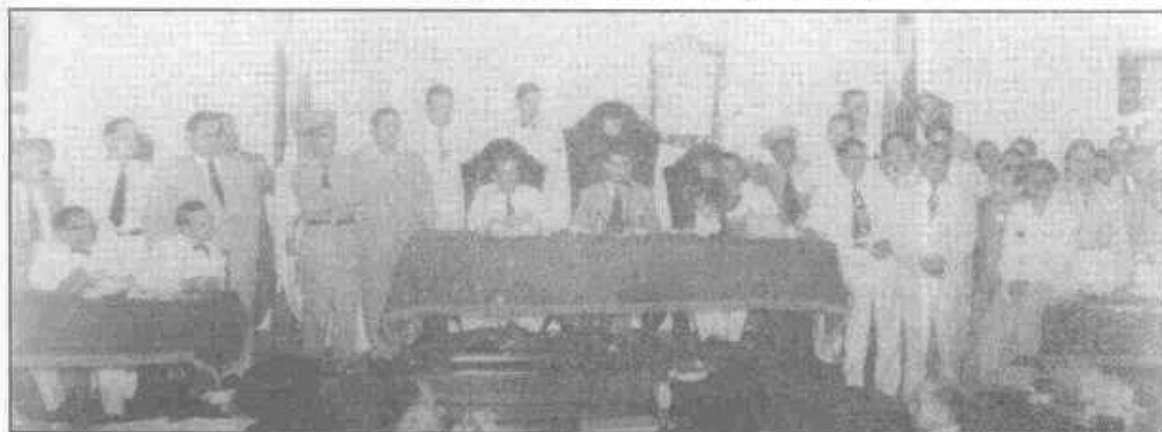
Chanis retira su renuncia ante la Asamblea Nacional.

La Asamblea Nacional entró en sesiones el 21 para aceptar o rechazar la re-