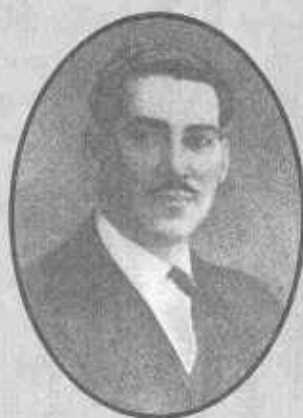
Arnulfo Arias Madrid