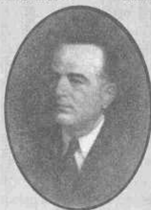
Roberto F. Chiari