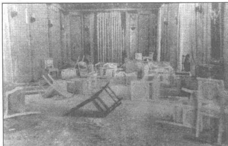
Estado del Sal6n Amarillo de la Presidencia de la Rep6blica despu6s del asalto del 10 de mayo de 1951.

Este caos obligó al gobierno a reconsiderar la derogatoria de la Constitución de 1946 y ese mismo 9 de mayo declaró sin efecto en todas sus partes el decreto del día 7. Sin embargo, la Asamblea Nacional se constituyó en Tribunal Juzgador, decretó la suspensión provisional de Arnulfo Arias como Presidente de la República y llamó al primer Vicepresidente Alcibiades Arosemena para ocupar la Presidencia del país. Es indudable que los enfrentamientos del día 9, que produjeron 3 muertos y más de 100 heridos, fueron decisivos para obrar con tanta celeridad. Dado que Arnulfo Arias no renunció había, una vez más en el país, dos Presidentes. Al día siguiente, cuando el Mayor Alfredo Lezcano Gómez y el Teniente Juan Flores se encaminaron a las oficinas del Ejecutivo armados con ametralladoras, para comunicarle a Arias la decisión de la Asamblea Nacional, ambos oficiales fueron muertos a tiros. Este fue el detonante para iniciar un intenso tiroteo entre los seguidores del Presidente y la Policía Nacional. En realidad, la actitud de este cuerpo fue una sorpresa para el gobierno, dado que, ese mismo día 10, los Comandantes habían