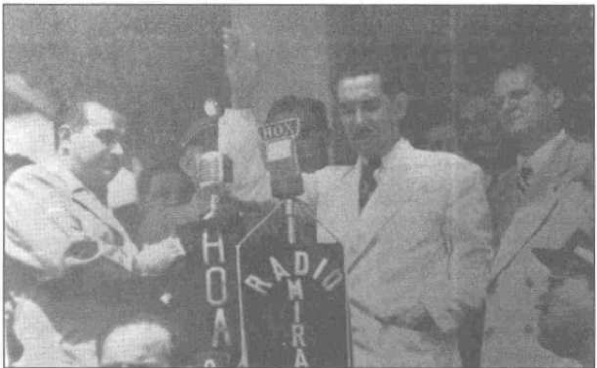
Arnulfo Arias toma posesión de la Presidencia en 1949.