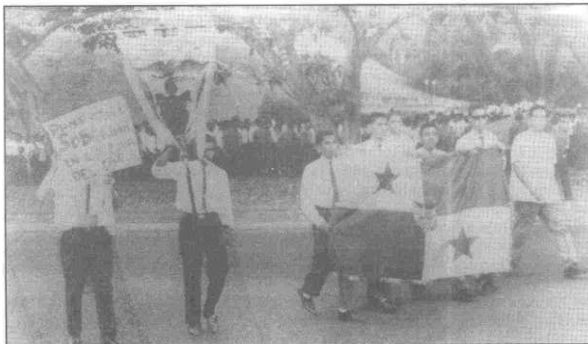
Los institutores marchan pacíficamente a la Zona del Canal, para izar la bandera panameña, el 9 de enero de 1964.

viaje hacia aquel país empeoró más aún la tensa situación imperante. En efecto, en la tarde del 9 de enero, alrededor de doscientos estudiantes del Instituto Nacional portando la bandera nacional se encaminaron, en forma pacífica, a la Escuela Superior de Balboa con el propósito de que se acatara el convenio con Estados Unidos. Aunque la Policía de la Zona del Canal en un principio los detuvo y luego permitió que seis institutores fuesen a izar el pabellón panameño en el asta frente al edificio de la mencionada escuela, poco después se sumó a la actitud hostil y agresiva de los estudiantes zoneítas y sus padres. La delegación de institutores no sólo fue insultada, golpeada y obligada a retroceder, sino que la bandera panameña fue destruida por un policía norteamericano. Reprimidos por las fuerzas policíacas zoneítas, los institutores se vieron forzados a retornar a la ciudad de Panamá. Fue entonces cuando otros ciudadanos se unieron a los estudiantes con el objetivo de que la bandera panameña se izará en la Zona del Canal, pero fueron rechazados por la Policía y algunos civiles estadounidenses armados con revólveres y escopetas. El trágico saldo de esta violenta e injustificada agresión durante las primeras horas de la noche del 9 de enero, fue de más de cien heridos y seis muertos.