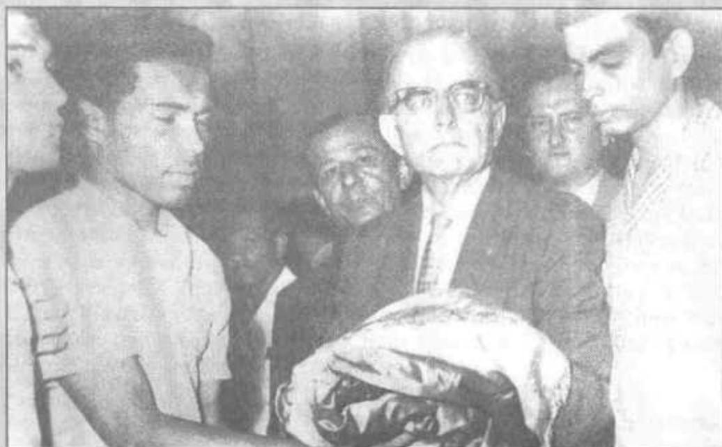
Los institutores entregan al Presidente Chiari la bandera panameña ultrajada en enero de 1964.