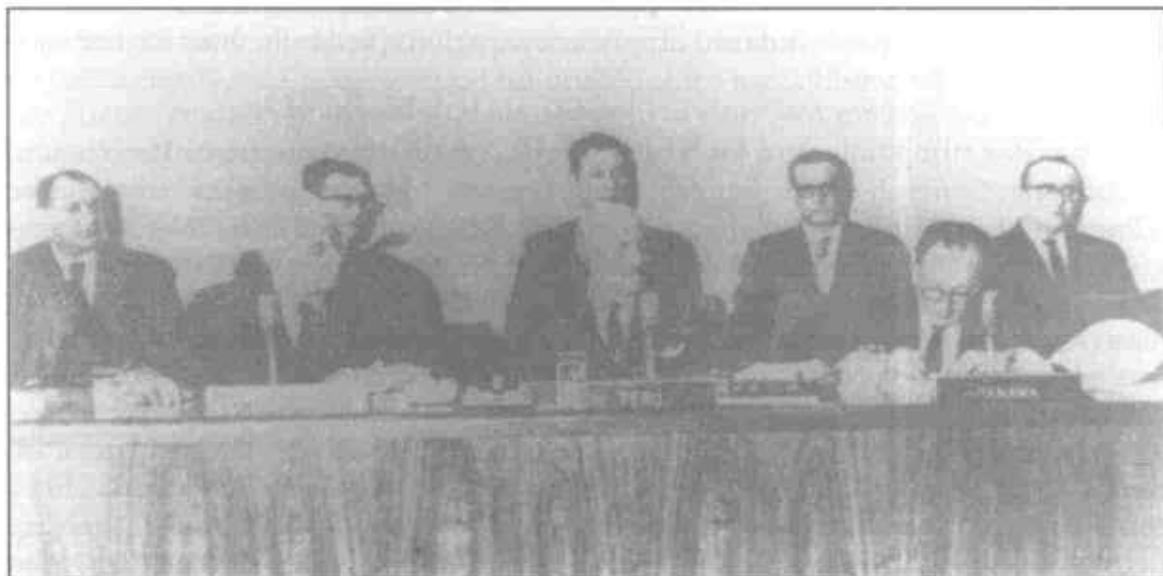
Firma de la Declaración Moreno-Bunker, del 3 de abril de 1964.

Canal de Panamá y para tratar de resolver otros problemas existentes entre ellos, sin limitaciones o precondiciones de ninguna especie". Dicho documento también señalaba que, dentro de los 30 días siguientes al restablecimiento de las relaciones diplomáticas, ambos gobiernos nombrarían "Embajadores Especiales con poderes suficientes para llevar a cabo discusiones y negociaciones con el objeto de llegar a un Convenio justo y equitativo que elimine las antedichas causas de conflicto y resuelva los demás problemas referidos". Estaba claro que cualesquiera convenios que resultaran estarían sujetos a los procedimientos constitucionales de cada país.