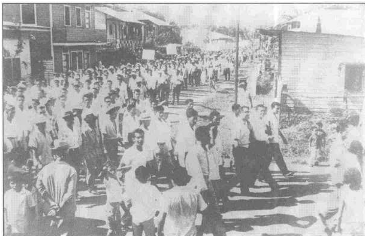
Escena de la huelga de los trabajadores de las bananeras en Chiriquí.