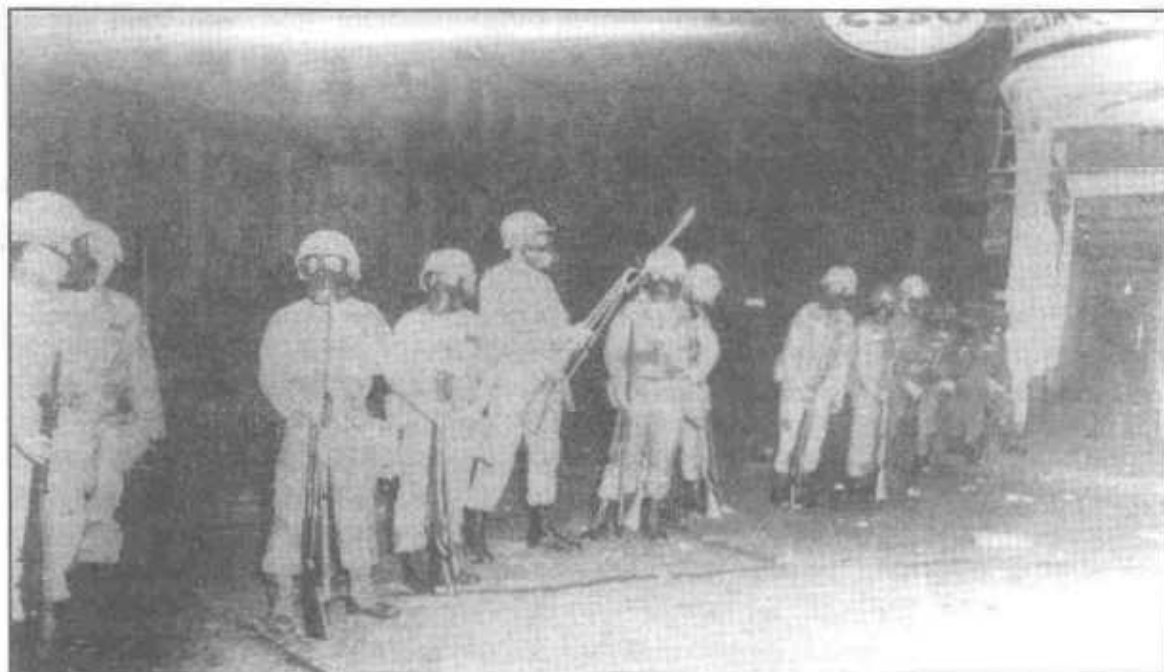
Tropas norteamericanas ocupan territorio bajo jurisdicción panameña en Colón.

A esta injustificada agresión armada de las tropas estadounidenses acantonadas en la Zona del Canal, contra la población panameña, debemos añadir la violación de la integridad territorial de la República, toda vez que el ejército norteamericano ocupó el Corredor de Colón cerrando la Carretera Transistmica y lo mismo hizo con el Puente de las Américas. Todo ello, además, iba contra lo establecido en el artículo 6 de la Convención del Canal Istmico de 1903. Ante esta brutal represión el pueblo panameño reaccionó lanzando piedras y destruyendo las oficinas de la U.S.I.S., la Goodyear , la Tropical Radio y ALL American Cable , mientras que el establecimiento de la Casa América, que se dedicaba a la venta de armas de fuego, fue saqueado. Asimismo, se incendió el edificio de la Pan American World