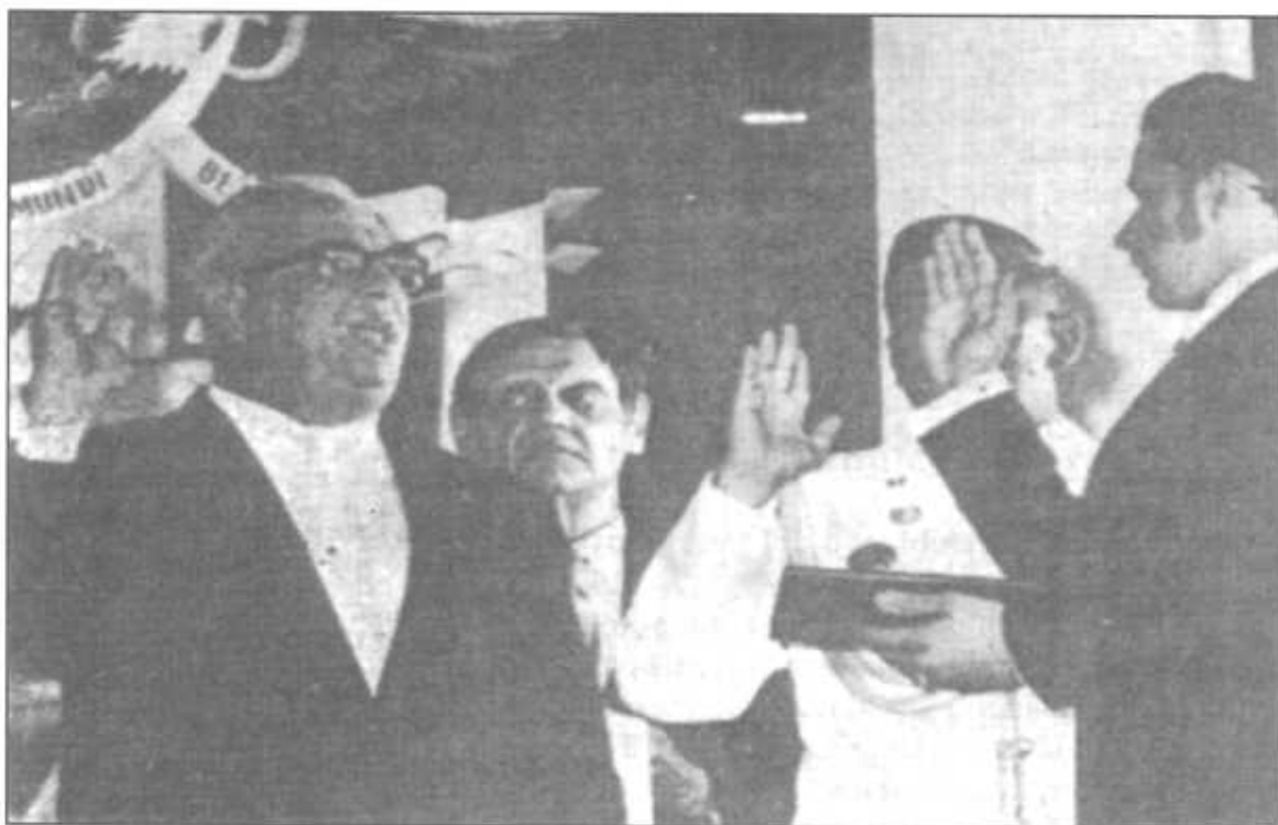
Demetrio B. Lakas asume la Presidencia de la República en octubre de 1972.