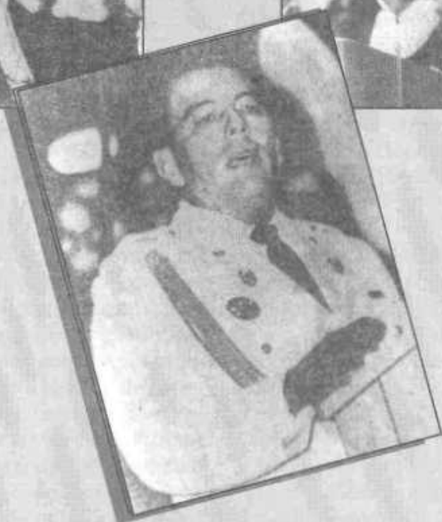
Demetrio B. Lakas, Omar Torrijos y Aristides Royo.