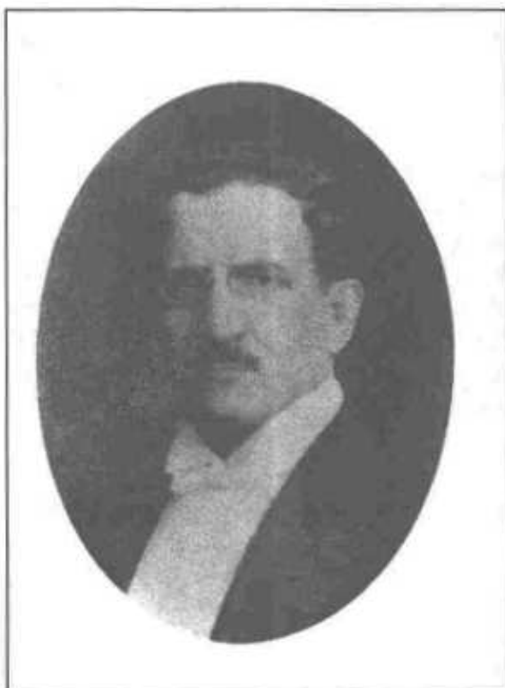
Ricardo J. Alfaro

Es preciso resaltar la loable labor que realizó Ricardo J. Alfaro durante el breve período en que ejerció el Poder Ejecutivo, es decir del 16 de enero de 1931 al 1 de octubre de 1932. Al tomar posesión de su alto cargo ante la Corte Suprema de Justicia, Alfaro expresó que su programa de trabajo se podía condensar en dos puntos primordiales: "El primero es la repudiación completa y absoluta de los viejos errores y de los sistemas viciados, y por tanto debo comenzar por la declaración de que el nuevo gobierno no ejecutará ni permitirá ninguna de las prácticas que atraieron sobre el anterior la condenación de la opinión pública. El segundo es de llevar a la práctica, hasta donde ello sea humanamente posible, los ideales puros y patrióticos en que la ciudadanía nacional se halla inspirada y que no tengo necesidad de pormenorizar, porque estos ideales están, por decir así, flotando en la atmósfera o escritos en el claro firmamento de la patria".