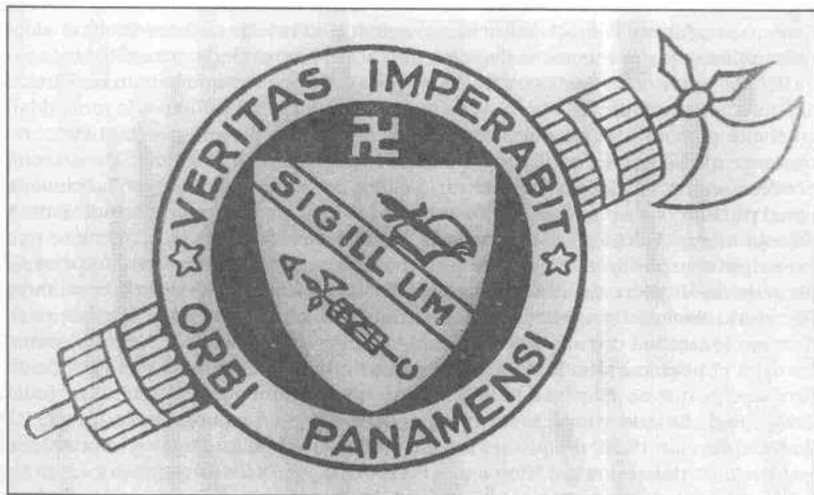
Emblema de «Acción Comunal».

no respondía a los planteamientos del primer mandatario y a su vez éste no contaba con el apoyo de ningún grupo. No dudamos que tendría seguidores y simpatizantes, pero no existía maquinaria política alguna que avalara y sostuviera su gestión. Esto explica por qué el 2 de enero de 1931 en ocasión de su derrocamiento por parte de Acción Comunal, ninguna agrupación se solidarizó con el ingeniero Arosemena. Muy por el contrario arremetieron los ataques en su contra, sin que se reconocieran los avances propiciados durante su gestión de gobierno. Desafortunadamente, la idea de que su administración fue nefasta para el país, ha pasado de generación en generación hasta el presente.