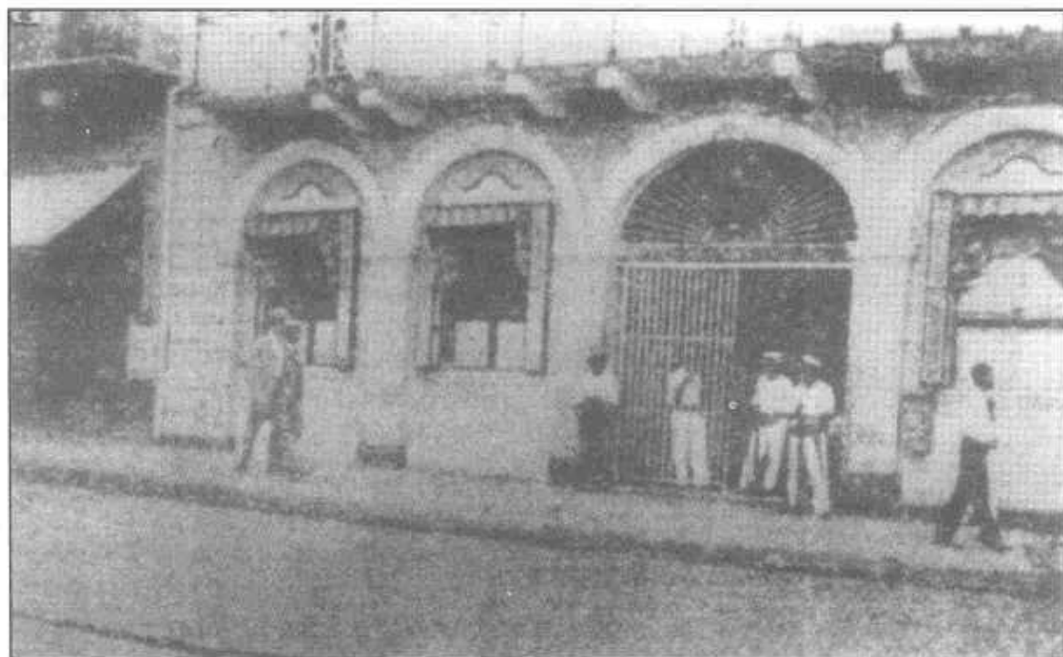
La Alcaldía del distrito capital es vigilada por «Acción Comunal» el 2 de enero de 1931.

Pese a la rendición de la Guardia Presidencial y al encarcelamiento y detención de la mayoría de sus allegados, el depuesto mandatario se negó a renunciar de inmediato y sólo lo hizo tras 12 horas de negociaciones cuando vio en peligro la seguridad de su familia. Si bien el escogido por Acción Comunal para sustituir a Florencio Harmodio Arosemena, era Harmodio Arias, el Ministro Roy Tasco Davis fue el que impuso las condiciones para la sucesión presidencial. A decir de Julio Linares, Davis en todo momento exigió "el mantenimiento del orden constitucional". Incluso conferenció personalmente con Arosemena para que dimitiera. Fue por eso que la Corte Suprema de Justicia, a la sazón presidida por Manuel Herrera, e