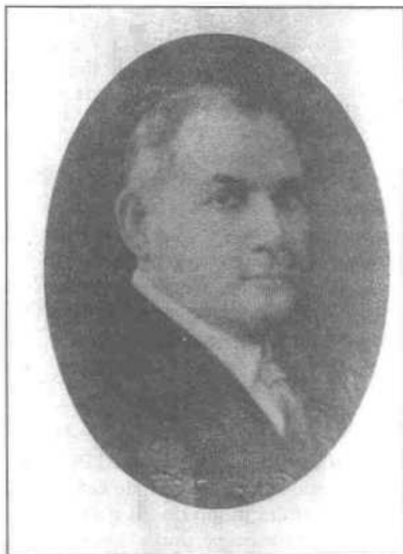
Florencio Harmodio Arosemena