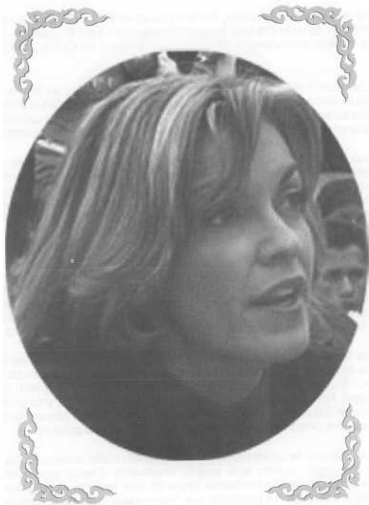
Dra. María Emma Mejía Oradora de Fondo