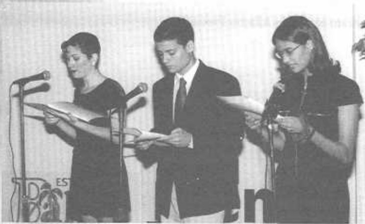
Grupo de teatrístas universitario, dramatizando los cuentos ganadores la noche de premiación.

En nombre de mis compañeros del jurado felicitamos a los organizadores y auspiciadores de esta hermosa actividad, pues sus objetivos y productos son abono para construir nuevos valores humanos que nos acercan a un mundo de igualdad y equidad en donde las discriminaciones serán resabios de culturas atrasadas.