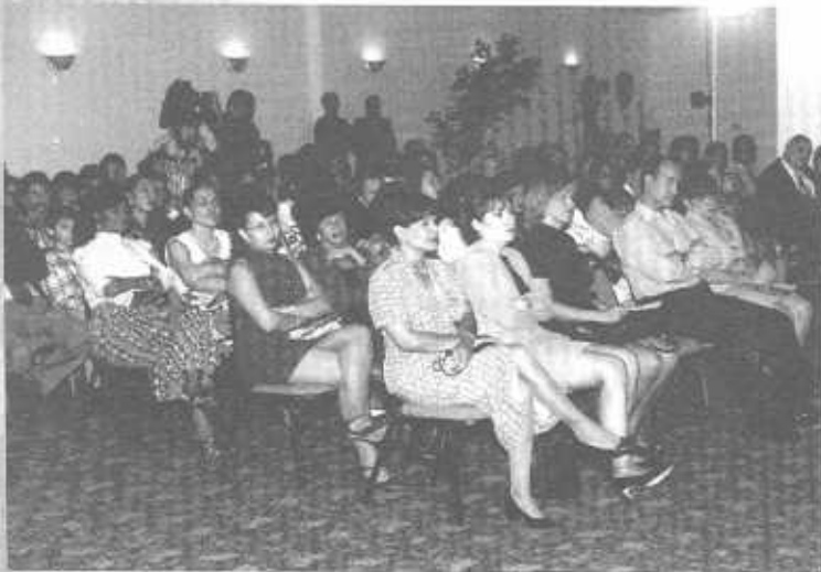
Público asistente a la noche de premiación.

Identificar a los niños como semillas de esta nueva sociedad es para todos muy obvio pero no lo son los caminos por los cuales transitar para llegar a ellos, para dialogar con ellas y para recordar nuestra niñ(a) interior que muchas veces olvidamos que forma parte de nuestra identidad y que con la manía de aparentar estar adaptados a este mundo de adultos, rechazamos.