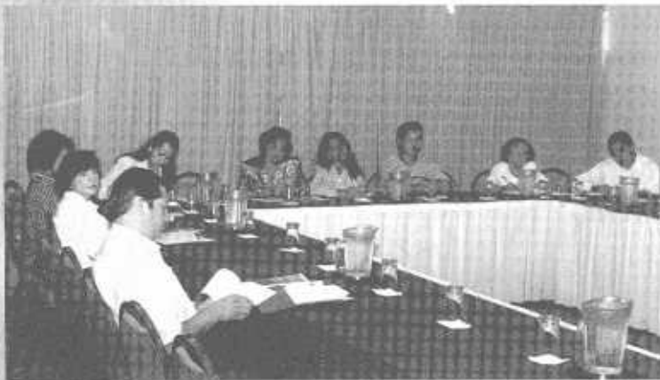
Concursantes en el Taller "El Género en la Literatura Infantil".