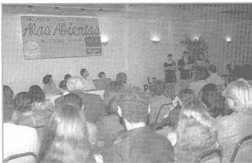
El concurso infantil nacional Alas Abiertas es una oportunidad de utilizar la literatura como un instrumento de cambio.

El género teatro fue declarado desierto por el jurado, a falta de encontrar obras que cumplieran con los requisitos básicos del concurso (enfoque de