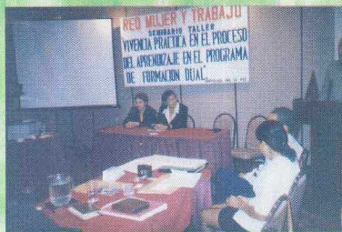
Vista parcial del Seminario Taller y actualización de los Capacitadores del Programa de Formación Dual

En la gráfica se observan a varias participante de partiendo amenamente en el convivio de fin de año realizado por la red.