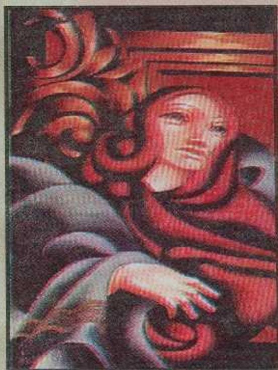
César Cuello/ Sin título

En el marco de "NATURALEZA Y MUJER" se realizó la "EXPO ALTERNATIVA" del 18 de julio al 10 de agosto del presente año, en la cual se expusieron más de 85 obras que no pasaron el periodo de curaduría.