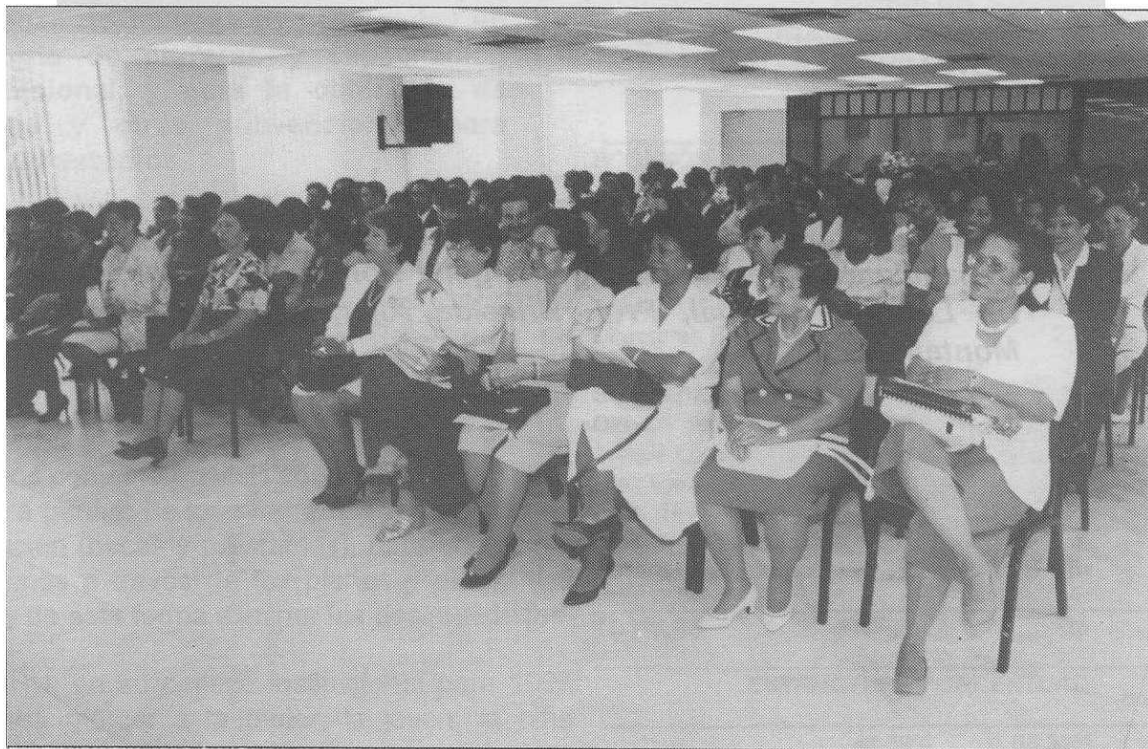
Vista de las personas que asistieron al acto de Inauguración.