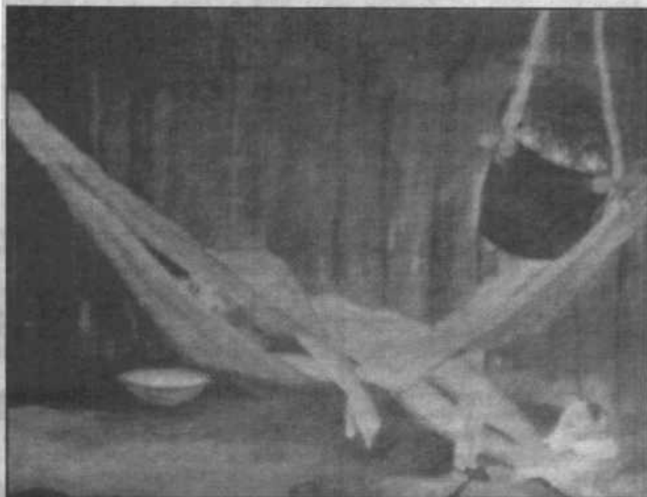
Al alba. Óleo de Yolanda Guerrero de Latorraca.